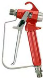
Airlesspistole Ag2000 500bar