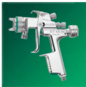
SATA K3 HVLP