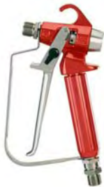
Airlesspistole Ag2000 500bar